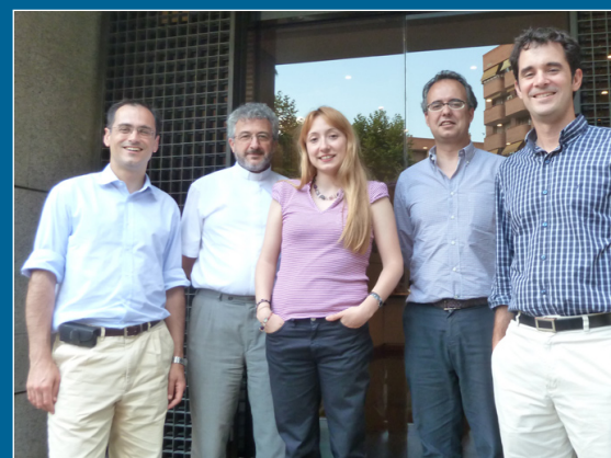
Incontro partemr - Sede CECE a Madrid

Il progetto è portato avanti dall'Associazione Davide.it in partnership con Intermedia Consulting di Roma e Cece (Confederación Española de Centros de Enseñanza) di Madrid e ha l'obiettivo di sensibilizzare ragazzi, insegnanti e genitori di cinquanta scuole italiane e spagnole all'uso sicuro e consapevole dei social media, attraverso un approccio educativo congiunto, fondamentale per un intervento più