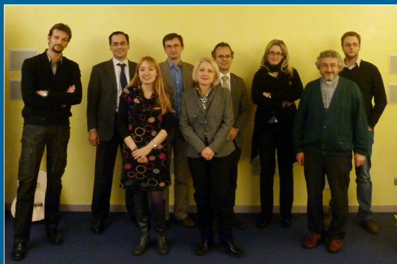
Incontro partner - Sede DAVIDE.IT a Venaria Reale (TO)

Solo se anche loro sono consapevoli dei pericoli e delle potenzialità dei social media possono trasmettere informazioni corrette ai ragazzi e saper affrontare eventuali situazioni di pericolo.